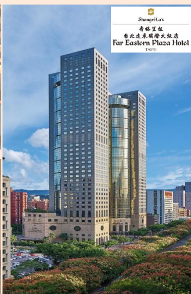
Shangri-La's 香格里拉 台北遠東國際大飯店 Far Eastern Plaza Hotel TAIPEI