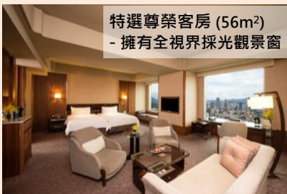
特選尊榮客房 (56m 2 ) - 擁有全視界採光觀景窗