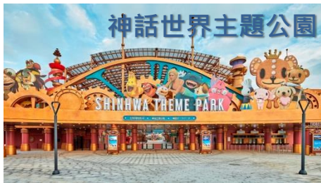
神話世界主題公園