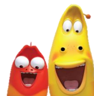
人氣動畫人物 Larva主題園區