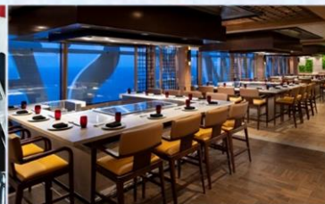
*日式鐵板燒：供應午晚餐，提供新鮮海產及頂級肉類，正宗日式美食應有盡有