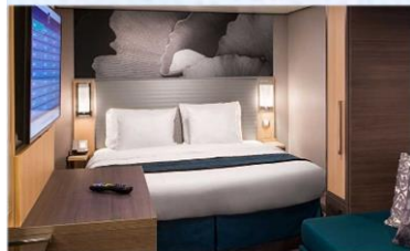
內艙房 (1V/2V/3V/4V)：166 平方呎