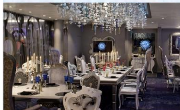
*大董意境坊：供應晚餐，與名店大董合作，體驗中國風的意境菜