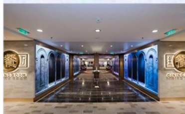
主餐廳：供應早午晚三餐的中西式美食