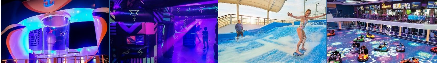
甲板跳傘 Z 星大戰™ 甲板衝浪® 碰碰車