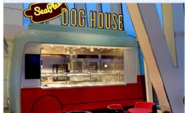
熟狗屋：品嚐不同風格的熟狗：紐約風格、芝加哥風 270 度咖啡廳：供應早午餐，品嚐多款熱三文治、格或你的個人風格。