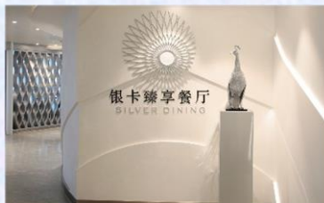
Sea Class 海際套房系列專屬餐廳