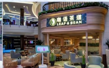
*咖語茶道：滿足各年齡層賓客，供應中國茶、咖啡等冷熱飲品，以及現烘中西式點心