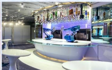
*機器人酒吧：科技感十足的機器人酒吧，輕鬆下達指令，即可調製專屬特飲