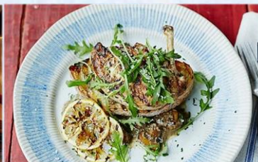
*Jamie's Italian：供應午晚餐，由名廚 Jamie Oliver 主理，打造正宗意式風味