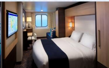
海景房 (1N/2N)：182 平方呎