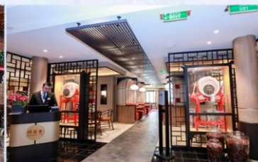
*川谷善：供應午晚餐，品嚐正宗川菜風味