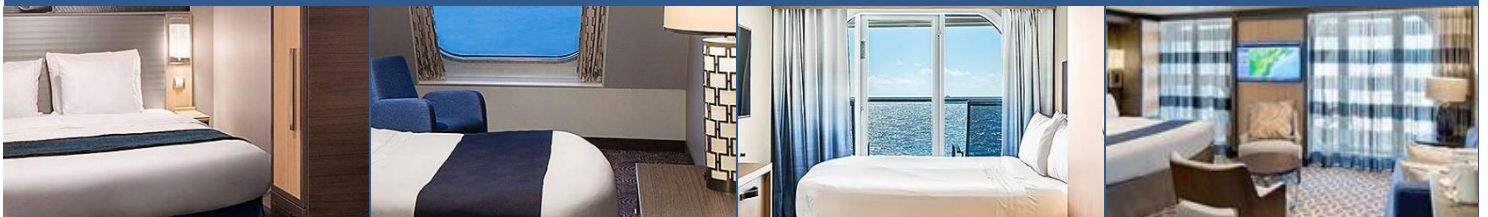
內艙房：約 166 平方呎 海景房：約 182 平方呎 海景露台房：連露台約 253 平方呎 標準套房：連露台約 331 平方呎