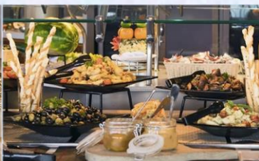
帆船美食廣場：供應早午晚三餐的環球美食自助餐