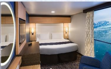
虛擬露台內艙房 (1U/2U)：166 平方呎