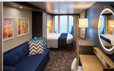
海景露台房 (1D/2D/3D/4D/5D)：198 平方呎