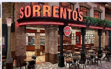
索倫托餐廳：供應午晚餐的意式 Pizza 美食